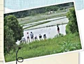
嬉地区での農家体験です

かつては興正寺別院を中心として宗教自治都市として栄えていた「富田林寺内町」。 現在でも古い町並みが残っており、重要伝統的建造物群保存地区にも選定されています。 最近では、古民家を活用した雑貨屋さんやカフェや工房なども増えてきて、訪れる楽しみも増えました。